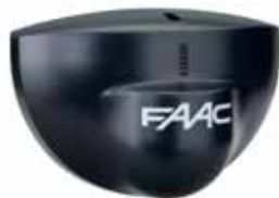
Radarmelder BFR2 (nur als Impulsgeber zu verwenden)

Artikelnummer 785 168 00 Preis (EUR) 228,00