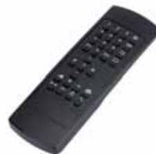
Fernbedienung TF1 (ausschließlich zur Einstellung von BFR2 geeignet)

Artikelnummer 785 180 00 Preis (EUR) 297,00