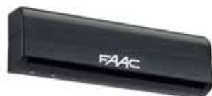
Infrarotsensor, aktiv HFMP1 (als Impulsgeber und Sicherheitseinrichtung zu verwenden)

Artikelnummer 785 170 00 Preis (EUR) 305,00