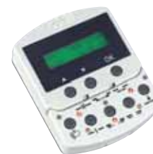
Programmierdisplay für KP-Controller Programmierdisplay zum Einbau in die Bedientastatur KP-Controller. Das Programmierdisplay erlaubt Programmierungen von allen zusätzlichen Funktionen

Artikelnummer 790 840 00 Preis (EUR) 182,00