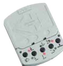
Bedientastatur KP-Controller Hiermit kann der Drehtürantrieb in den wesentlichen Funktionen von einem anderen Ort aus gesteuert werden (z.B. von einer Pförtnerstelle aus)

Artikelnummer 720 132 00 Preis (EUR) 12,00