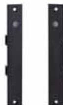
Frontplatten zu Miniswitch GLS (Paar, bei UP Montage erforderlich)

Artikelnummer 785 158 00 Preis (EUR) 168,00